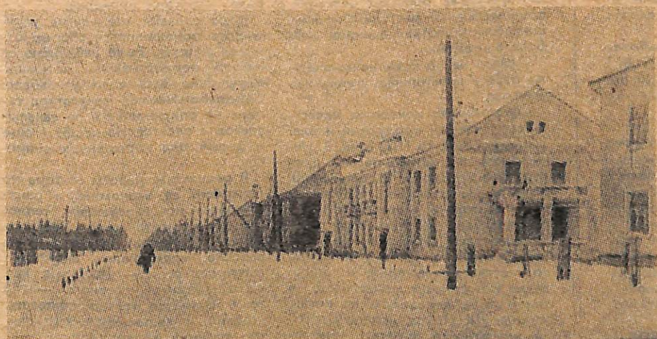
Улица Ленина 30 лет назад и сегодня.