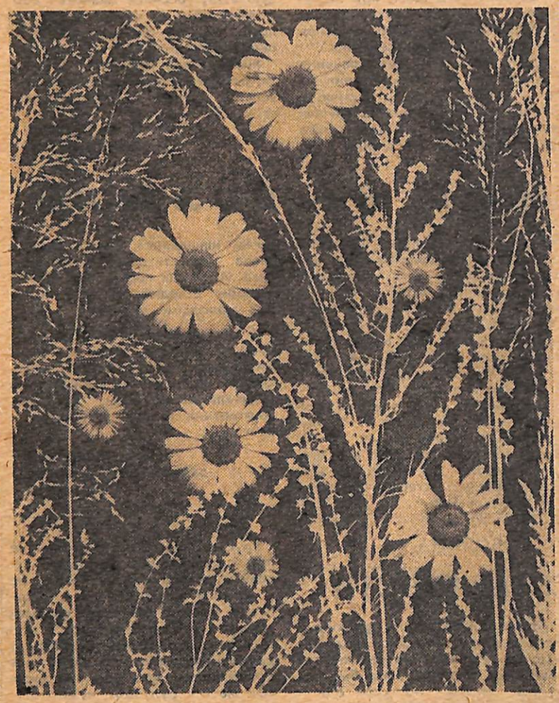
Из серии «Травы, травы...»