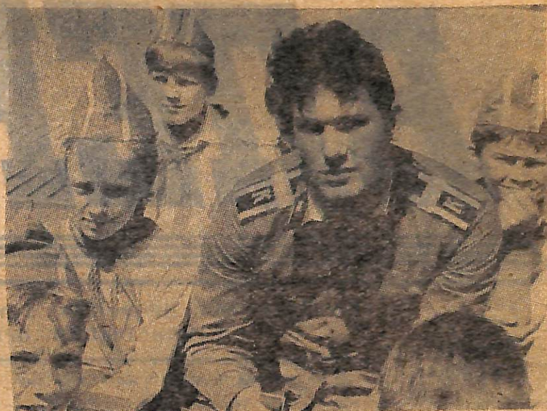
На снимке: «Зарница».

— Да «Зарница» закончилась у нас на прошлой неделе, и я бы сказал, была проведена ребятами отлично. Эту игру мы проводим ежегодно. Но эта, последняя, отличается от тех, что были раньше. Мы установили контакт с летчиками и парашютистами из Центрального аэроклуба имени Чкалова, которые согласились нам помочь.